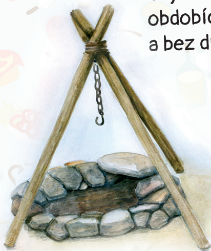
Pravěk (3 mil. let př. n. l.–4 500 př. n. l.)

Objevení ohně pro lidstvo znamenalo zásadní pokrok. Ve kterých obdobích historie se lidé v kuchyních při vaření neobešli bez ohně a bez dřeva? Přimaluj k obdobím, které vybereš, symbol ohně.