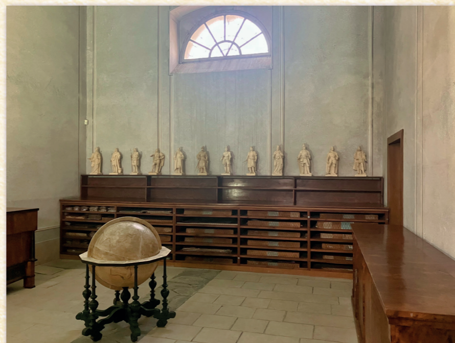
Cyklus sošek českých panovníků od Josefa Maxe

Supralibros (lat. nad knihou) nacházíme naproti tomu vždy vně knihy, a to buď na deskách nebo na hřbetu, ale též na deskových sponách, a dokonce i na ořízce (tedy na bočních stranách svázaných knižních archů; u starších knih je tato část zdobena mramorováním). Unikátním exponátem kačinské knihovny jsou krom samotných supralibros a exlibris jejich tiskové štočky .