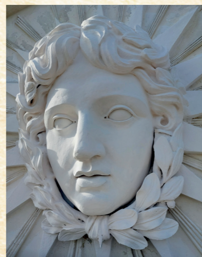
Nově zrestaurovaná maska boha Apollóna na tympanonu knihovny

Od hlavních dveří se táhne vysoká chodba lemovaná sloupovým, oddělujícím dvě boční oddělení. Chodba ústí do ústřední části, rotundy s prosklenou lucernou, která přivádí dovnitř denní světlo. Kruhová podlaha podtrhuje vznosný charakter celého knihovního prostoru. V kruhovém půdorysu se pnou i sloupy, skříně s policemi kopírují oblouky zdí. Směrem do zahrady pokračuje oddělení studovny a kartotéky. Vzniká tím okouzující knihovní scenerie, kterou s oblibou využívají filmová studia a která jen zdůrazňuje hodnotu národní kulturní památky zámku Kačina.