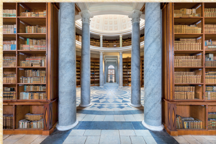
Pohled do knihovny od vstupních dveří

Šlechtické knihovny vznikaly obvykle po několik generací, tedy tak, že každý příslušník rodu obohacoval v průběhu času podle svého vkusu a podle svých zájmů rodovou knihovnu. Většinou tak nelze říci, že by ta která šlechtická knihovna byla obrazem jednoho konkrétního majitele, a proto je označujeme podle prostorů, kde se knihovny nacházejí, nebo jménem rodu: v našem případě kačinská nebo chotkovská knihovna .