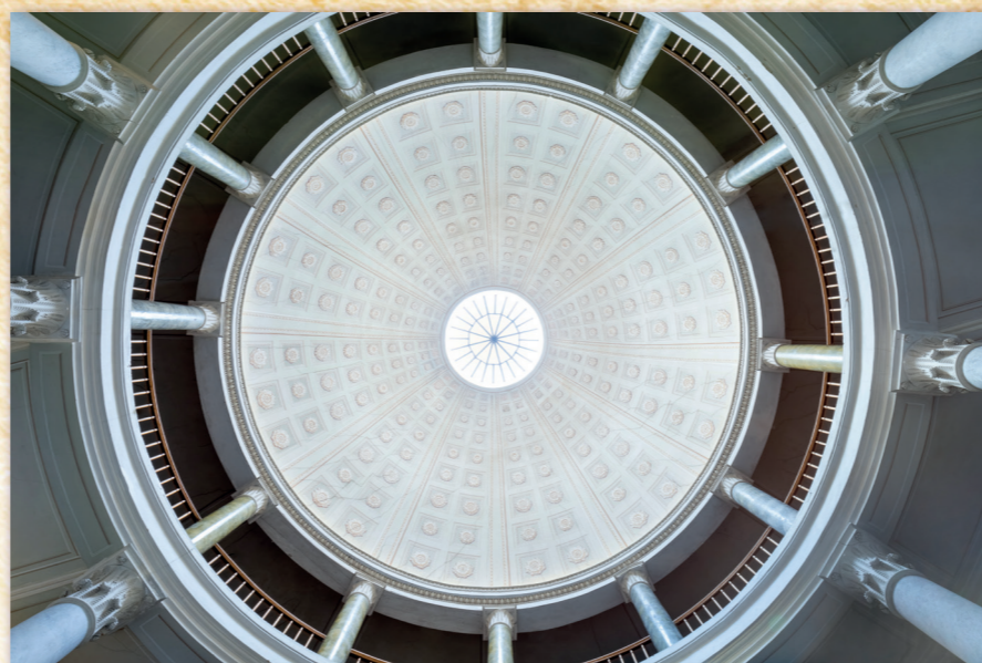
Pohled na galerii a kopuli knihovny

Za knihovnu v hrubé stavbě (zednické, kamenické a tesařské práce i s materiálem) včetně provedení podlah a omítek v interiéru zaplatil hrabě Chotek 27 tisíc zlatých (dnes asi 150 milionů korun ). Hlavní stavební aktivita se odehrávala kolem roku 1820, v následujících letech se zhotovovalo mobiliární vybavení. Knihovní regály musely být kvůli chybě vyzděným sloupům provedeny asymetricky , s různou úložnou