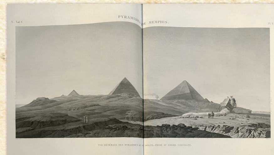
Popis Egypta (Description de l'Égypte)

Monumentální mnohosvazkové dílo Popis Egypta ( Description de l'Égypte ) bylo vydáváno ve Francii mezi léty 1801–1840 jako výsledek vědecké výpravy, která se účastnila společně s Napoleonovým vojskem tažení do Egypta (1798–1801; odsud proto laické pojmenování Napoleonův Popis Egypta ). Popis poprvé odborně dokumentoval egyptské památky, čímž položil základy egyptologie . Oborový vliv této publikace byl obrovský. Na vzniku se podílelo přes 160 vědců a odborníků a přes 2000 výtvarníků. Vědecká i typografická hodnota Popisu Egypta z něj činí monumentální dílo období tzv. moderních dějin (od Velké francouzské revoluce 1789).