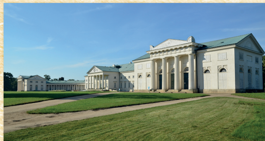
Zámek Kačina s divadelním pavilónem v popředí

V rámci realizace poslední etapy výstavby zámku se severní pavilón s kaplí a divadlem začal stavět roku 1818. Když v roce 1824 zemřel hlavní iniciátor stavby zámku hrabě Jan Rudolf Chotek, práce na divadle i kapli se na dlouhou dobu zastavily. Jako provizorní divadelní prostor sloužil na Kačíně tzv. taneční sál, kde se prokazatelně hrálo od roku 1844. Oficiální divadlo se podařilo dokončit až na počátku 50. let 19. století, zatímco zámecká kaple zůstala nedostavěna.