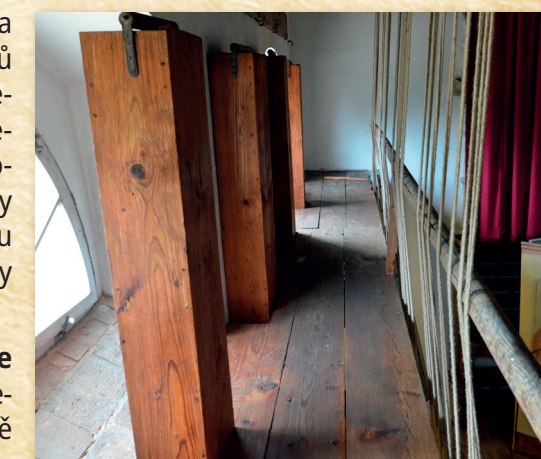
Lávka a 4 dřevěné šachty se závažími

Visutá lávka Sloužila k obsluze jevištních tahů – konopných provazů vedených kladkovým systémem zavěšeným na stropě. Jednotlivé provazy byly upevněny k prknu nad lávkou a označeny značkami.