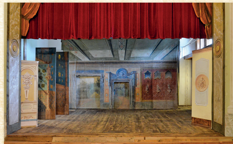
Jeviště se všemi typy divadelních dekorací – boční dekorace, prospekty a sufity

Přestože byl Rudolf Karel Chotek poměrně plodným autorem, který po sobě zanechal 14 divadelních her (12 napsaných německy a 2 česky), převažovaly v repertoáru kačinského divadla hry oblíbených dobových autorů. Zpočátku zde dominovaly ty z pera Augusta von Kotzebue (1761–1819), jenž byl v první polovině 19. století nejhranějším dramatikem německy mluvících oblastí střední Evropy. Jeho jedno či dvouaktové humorně laděné žánrové hry s lechtivými zápletkami se obvykle odehrávaly v interiéru a obešly se bez složitých dekorací i početného hereckého obsazení. Postupem doby se na Kačíně začaly hrát také náročnější