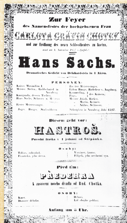
Oznámení slavnostního otevření divadla na Kačíně (1851)

Kačinský divadelní sál, jenž pojal až 300 diváků, byl slavnostně otevřen 9. listopadu 1851. Hrál se zde pravidelně 3 až 4krát do roka, nejčastěji u příležitosti rodinných oslav nebo pro pobavení významných hostů. V rámci divadelních večerů se obvykle odehrála 2 až 3 kratší představení. Odehrané divadelní hry se nikdy nereprizovaly. Mezi roky 1844–1869 se v prostórách kačinského divadla a velkého tanečního sálu uskutečnilo celkem 59 divadelních večerů, během