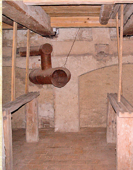
Vyústění topného systému v podjevišti

Otopný systém V chladných měsících se v divadle udržovala teplota pomocí systému horkovzdušného vytápění, jehož rozvody se dochovaly v prostoru pod jevištěm. Systém se skládal z plechové kotle umístěného v malé uzavřené místnosti pod chodbíčkou vedoucí na jeviště. Z kotle vedla jedna trubka do komína odvádějící kouř, druhá trubka, vycházející ode dna kotle, vedla horký, ale nezakouřený vzduch do spletité soustavy trubek, kde se horký vzduch ochlazoval na bezpečnou teplotu. Systém ústl do prostoru pod jevištěm: jeden výduch směřoval do volného prostoru a oteploval ho, další ústl do zděných kanálků u stěn podjeviště, z nichž vedly výdušné otvory kryté železnou mřížkou na jeviště. Další dva průduchy ústily do orchestřiště. Stejným systémem byl rovněž vytápěn prostor pro šatny herců.