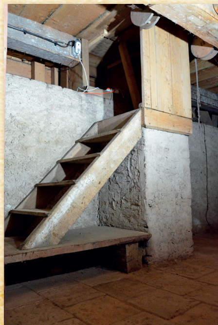
Budka nápoředky, hraněné hřídele s koly vpravo nahoře

Nápořední budka Nápořední budka se nachází na okraji jeviště a je přístupná z prostoru pod jevištní plochou. Po obou stranách budky byly osvětlovací rampy, jejichž pohyb nahoru a dolů ovládala divadelní nápoředka. Rampový mechanismus využitý na Kačině, který se bohužel dochoval v torzovitěm stavu, nemá v rámci České republiky obdoby. Jako jeho předobraz podle všeho posloužil osvětlovací systém z drothningholmského zámeckého divadla tvořícího součást rezidence švédských králů. Tento mechanismus vyrobený ze dřeva tvořily dvě krátké hraněné hřídele opatřené na obou koncích většími koly. V přední části jeviště se nalézají malé kladky, které podle všeho sloužily k přesměrování provazů vedených od koncových kol na hřídelích k osvětlovacím rampám.