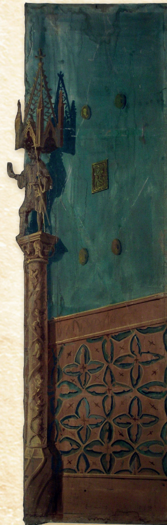
Boční kulisa v gotickém stylu

Na Kačině se uplatnila pozdní varianta tradičního kukátkového jeviště, které využívalo systém několika typů plochých malovaných dekorací. Výtvarně nejnáročnější a pohledově nejexpo-